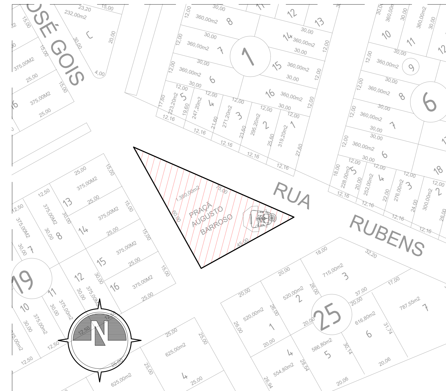
02 PLANTA DE SITUAÇÃO esc. 1:1.000