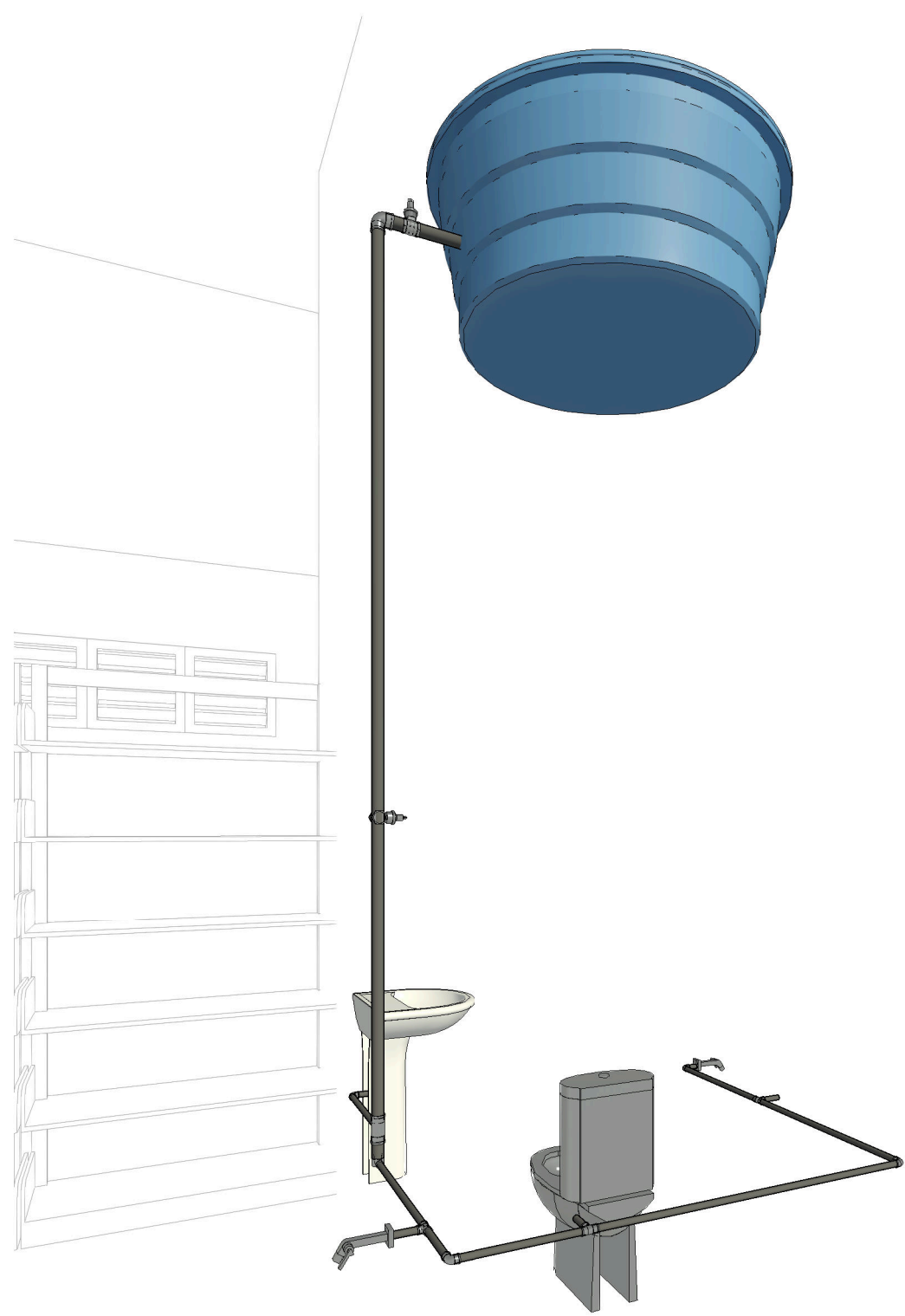
4 Vista 3D 1