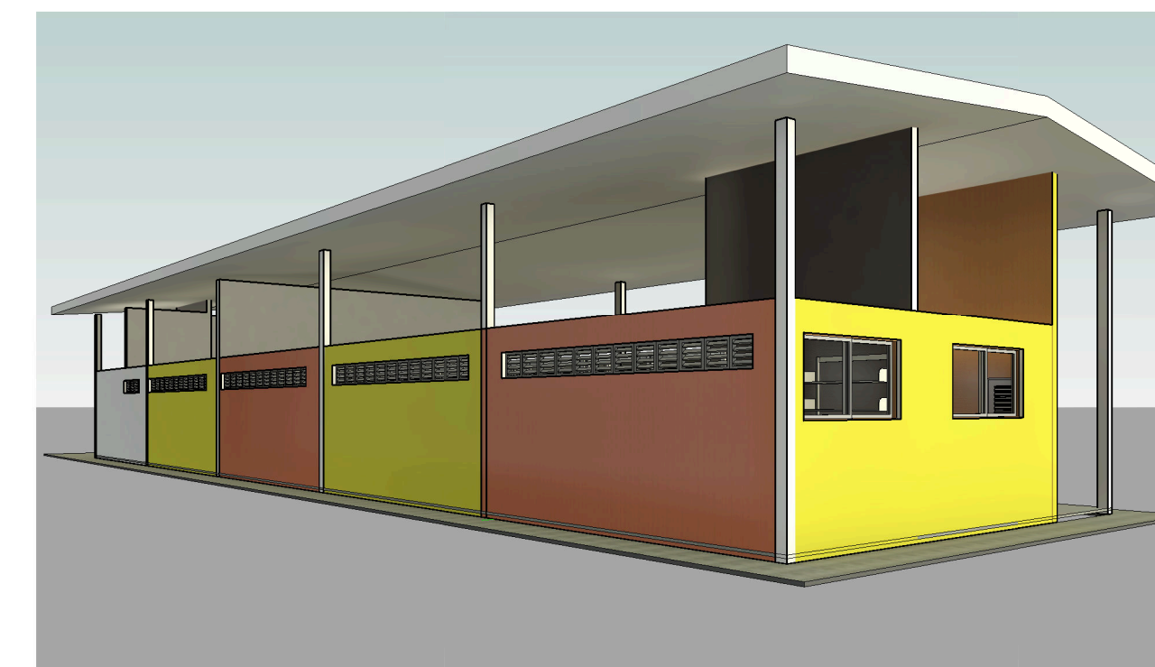
4 Vista 3D 3