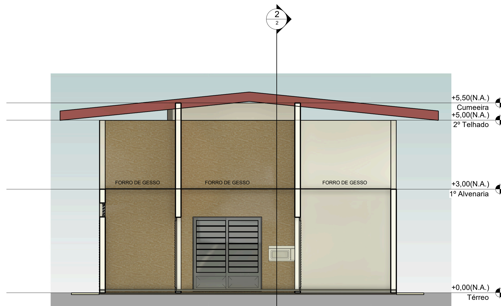
8 Section 3 1:50