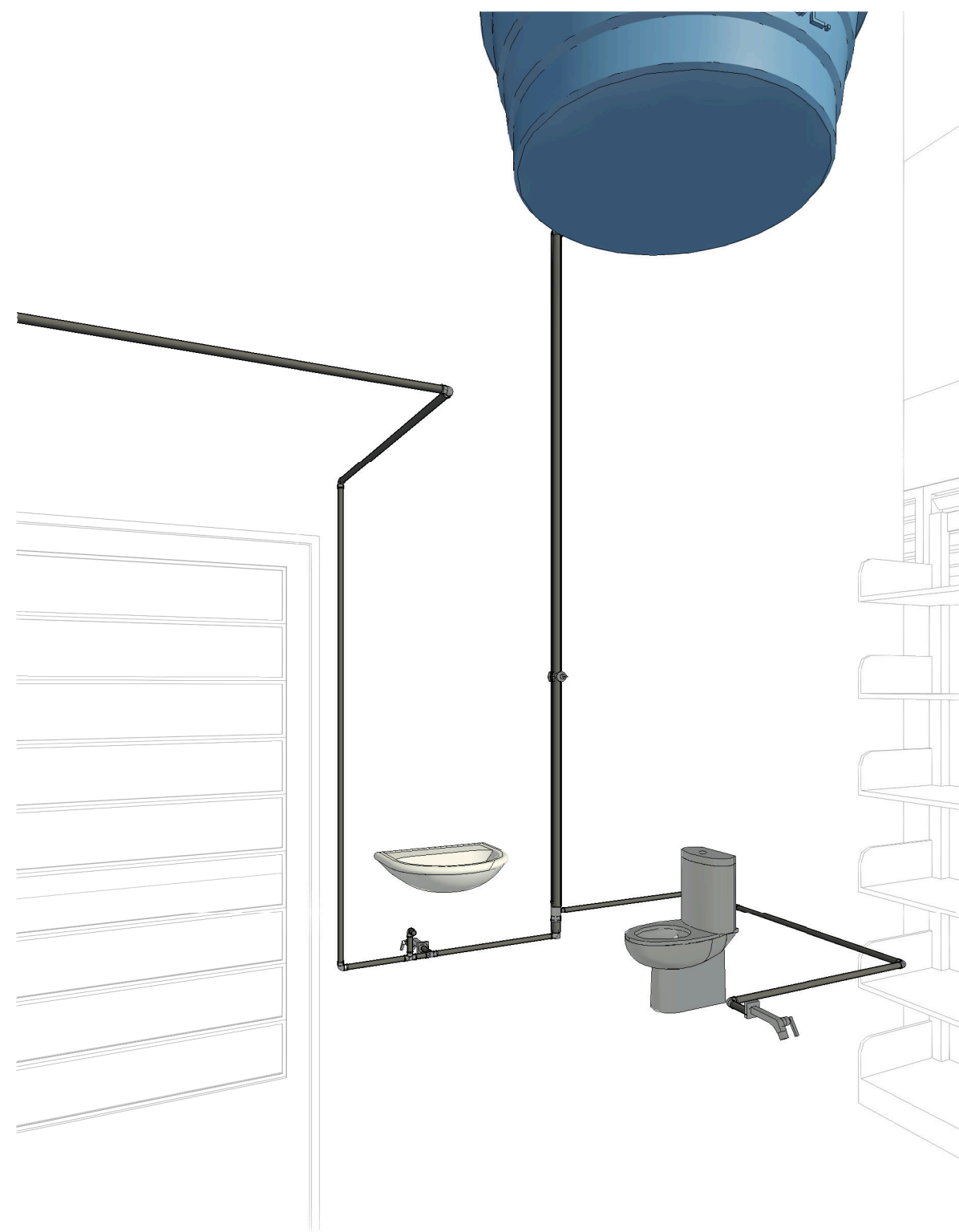
1 Vista 3D 4