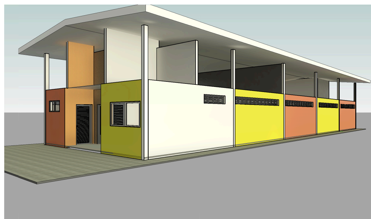
6 Vista 3D 5