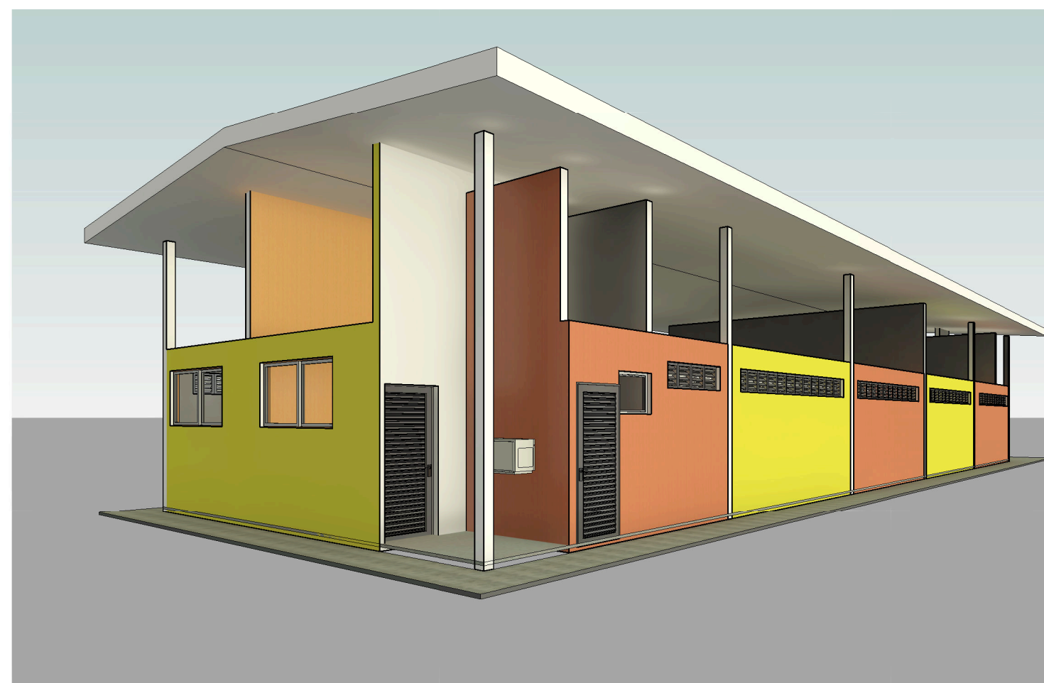
3 Vista 3D 2