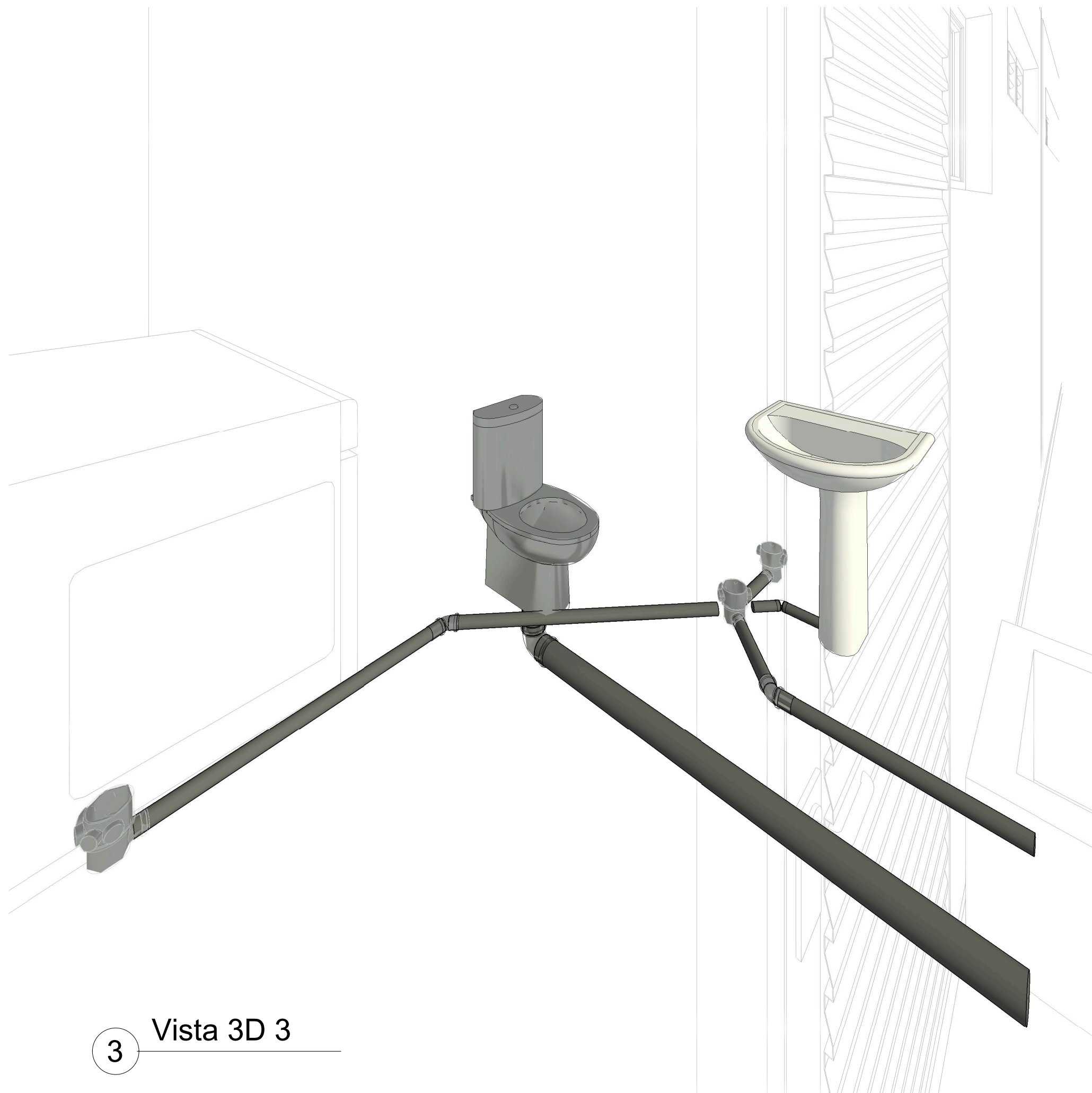
3 Vista 3D 3