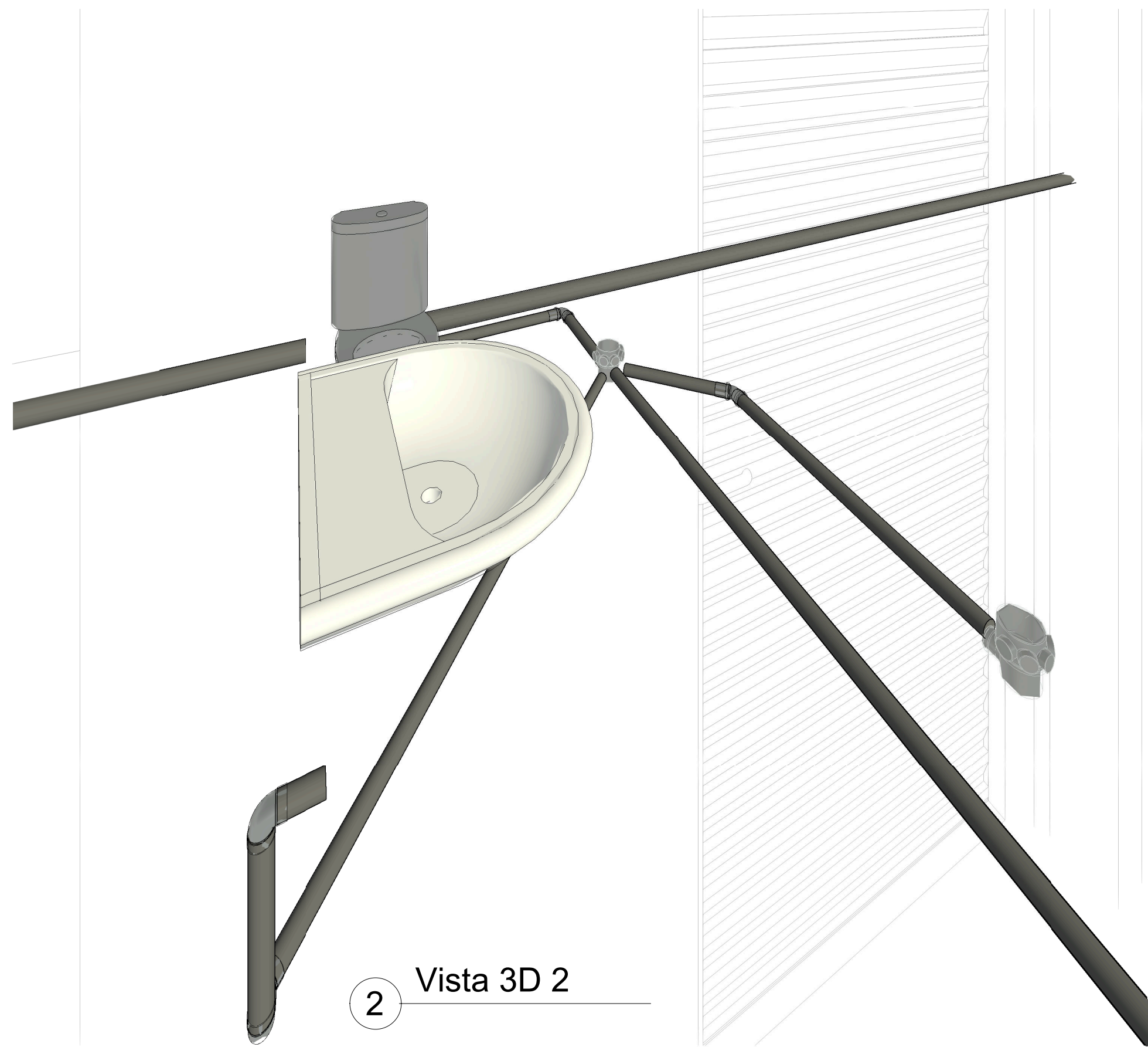
2 Vista 3D 2