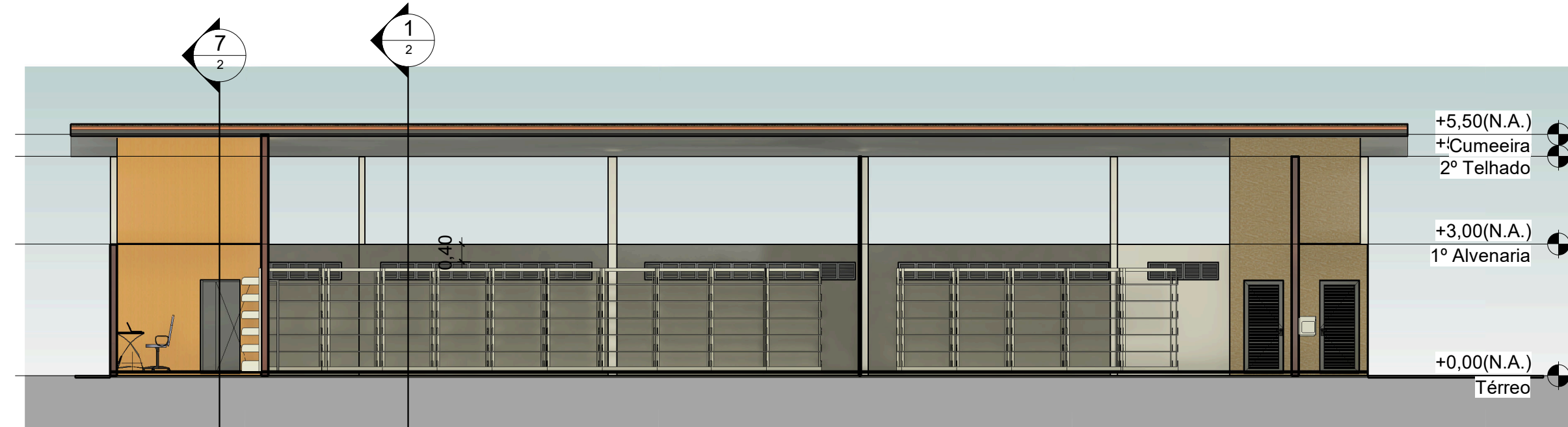
2 Section 1 1:100