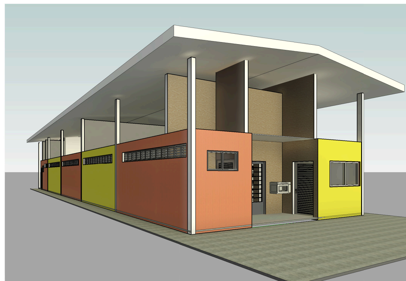
5 Vista 3D 4