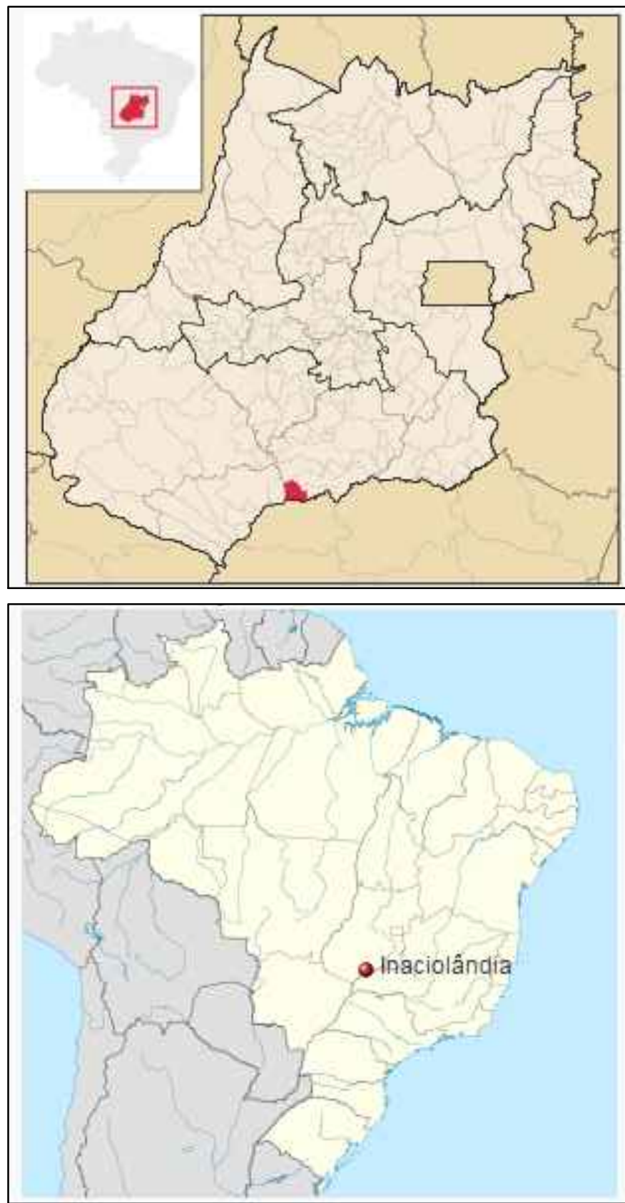
4 MAPA DE LOCALIZAÇÃO SEM ESCALA