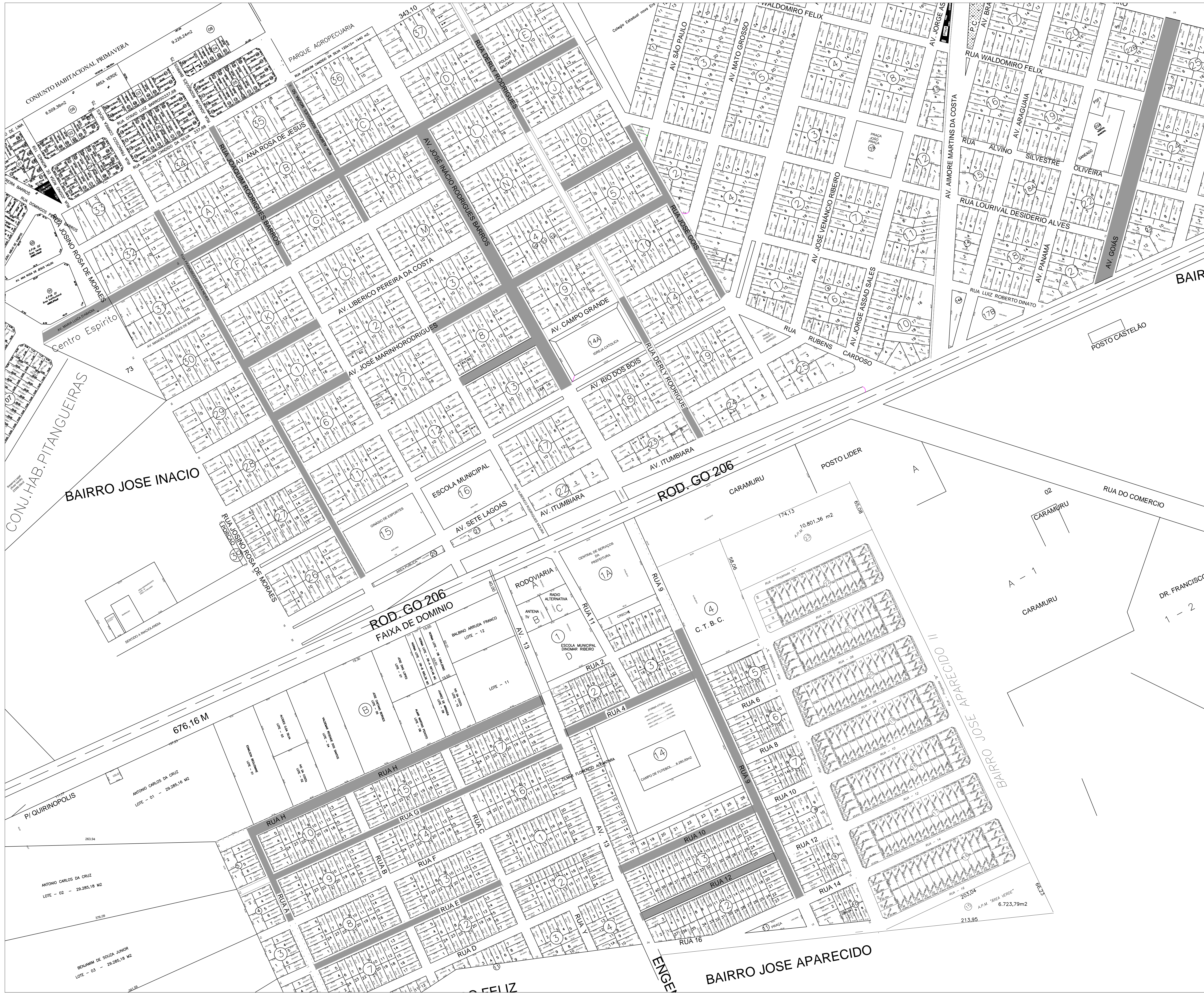
1 PLANTA ILUMINADA - RECAPEAMENTO INACIOLÂNDIA ESCALA 1/2000