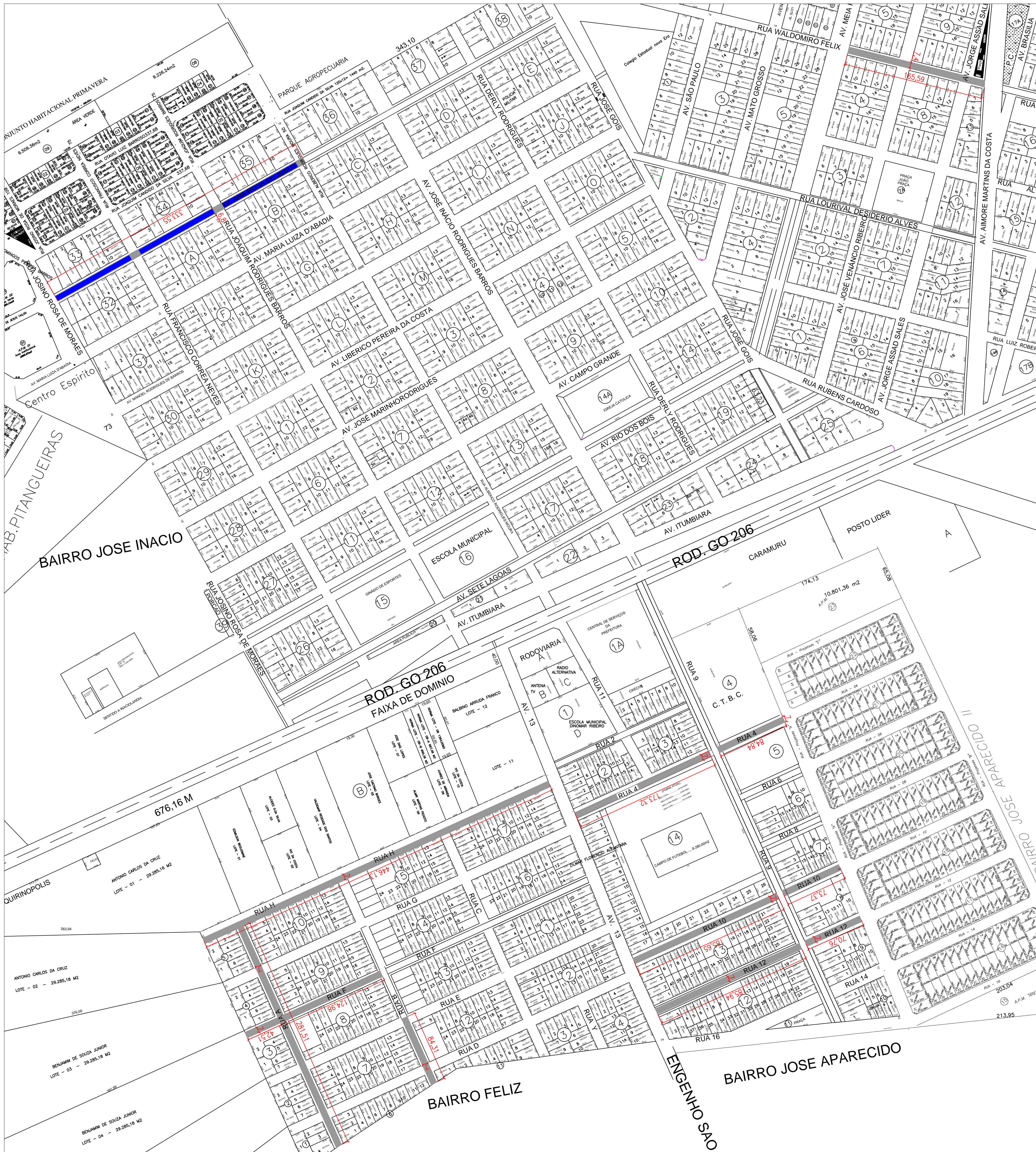
PLANTA ILUMINADA - RECAPEAMENTO INACIOLÂNDIA ESCALA 1/2500

LEGENDA: ÁREA A SER RECAPEADA ÁREA RECAPEADA- BM 01